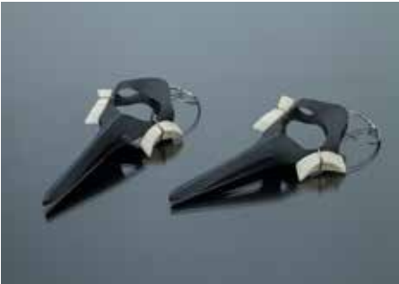
Agnes Gräf, 3. Preis für den Ohrschmuck „Pars thoracica“, 14. Rotary Gestaltungspreis 2019

Jede Teilnehmerin und jeder Teilnehmer fertigt zu dem ausgeschriebenen Thema DRUCK ein Produkt oder Objekt.