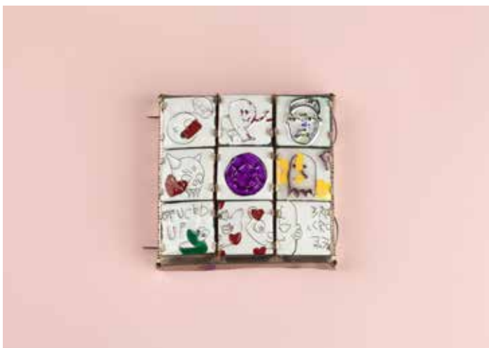
Leonie Damm, 1. Preis für die Kette „Fishing for Compliments“, 14. Rotary Gestaltungspreis 2019